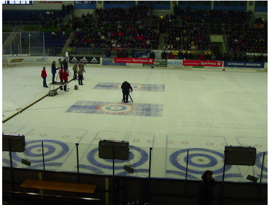
- farbige Zielfelder bei der EM in Garmisch -