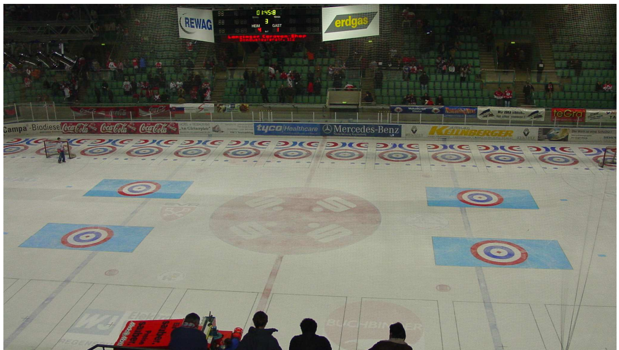
- farbige Zielfelder bei der EM in Regensburg -